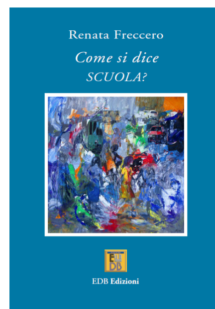
Come si dice SCUOLA? di Renata Freccero

Il partenariato comprende Regione Emilia-Romagna, il Parco Lombardo della Valle del Ticino, il Parco Regionale Veneto del Delta del Po, l'Ente Parco del Delta del Po dell'Emilia-Romagna, l'Università di Bologna, l'Università di Ferrara, G.R.A.I.A. srl - Gestione e Ricerca Ambientale Ittica Acque e l'Istituto Ricerca Ittica 'DEMETER' (Grecia).